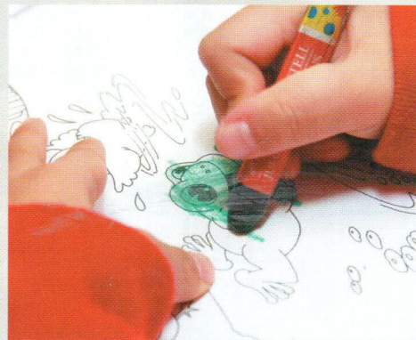
▲小朋友拿着顏色筆表現雀躍，以繪畫吸引他們學習普通話，也是好方法之一。